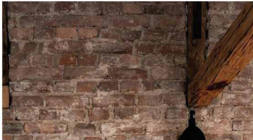
Inspirationsbilder från Tengbom Arkitekter.